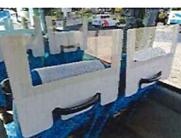
(飛沫防止パーテーション)